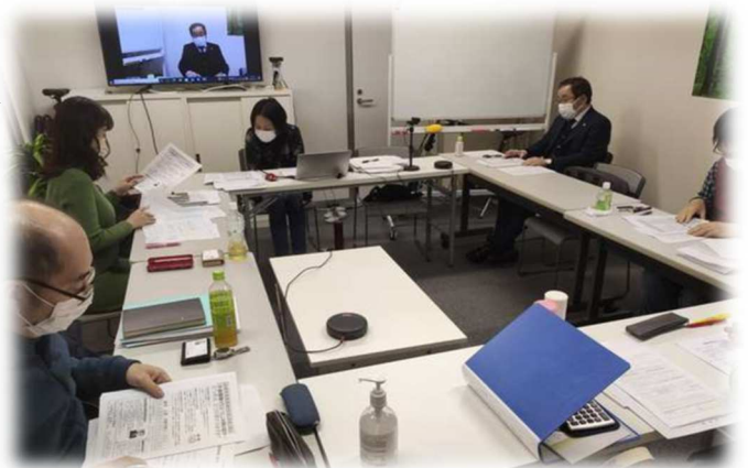
開業めざす社労士さんたちに秘伝をアドバイス