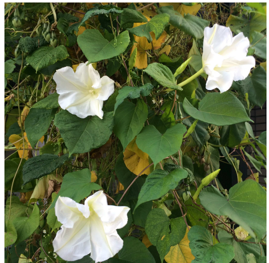
夕顔の盛りは9月です(温暖化の影響?)

は労働基準法に置き換えることができます。つまり、労働基準法に書かれていることをすべて就業規則に書く必要はないし、労働基準法を下回ることを定めてもダメなので